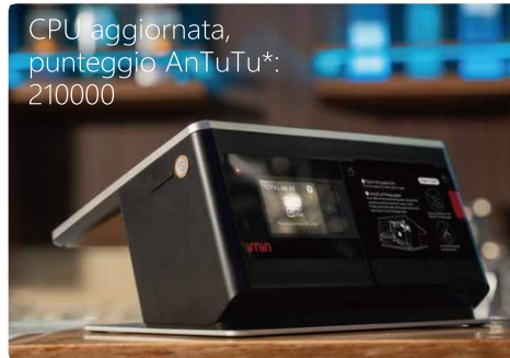
CPU aggiornata, punteggio AnTuTu*: 210000