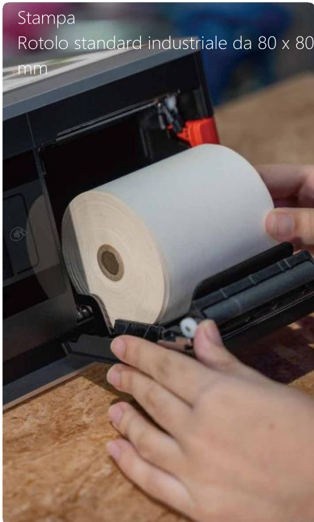
Stampa Rotolo standard industriale da 80 x 80 mm