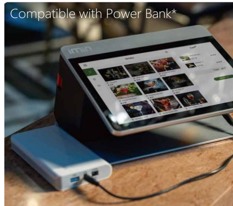
Compatible with Power Bank*