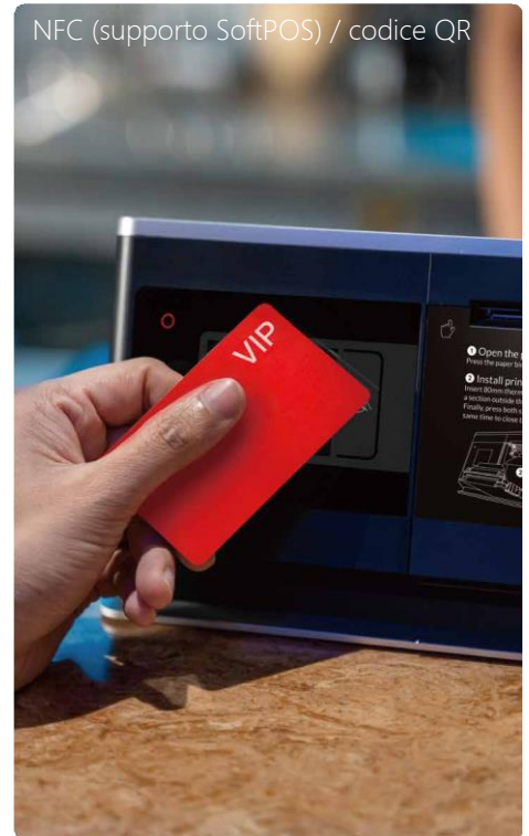
NFC (supporto SoftPOS) / codice QR